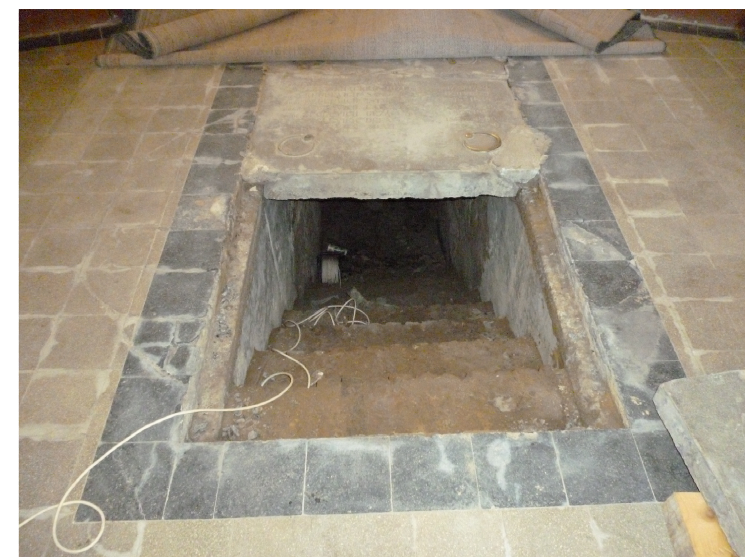
a kriptá lejárata