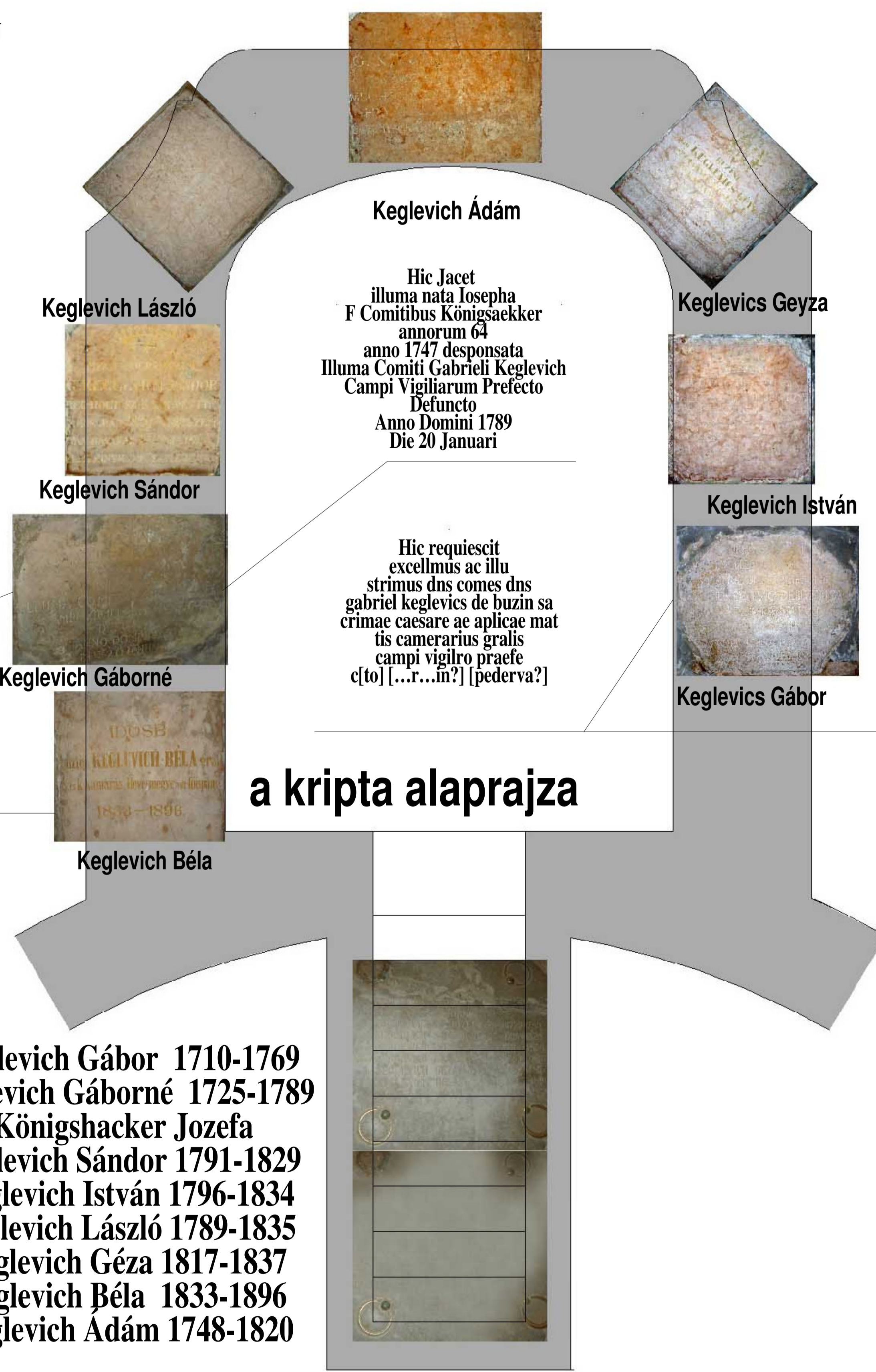
a lejáratot fedő kőlapokon olvasható a kriptában nyugvók neve