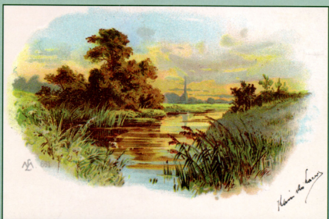
Képek a Tápió-vidék múltjából