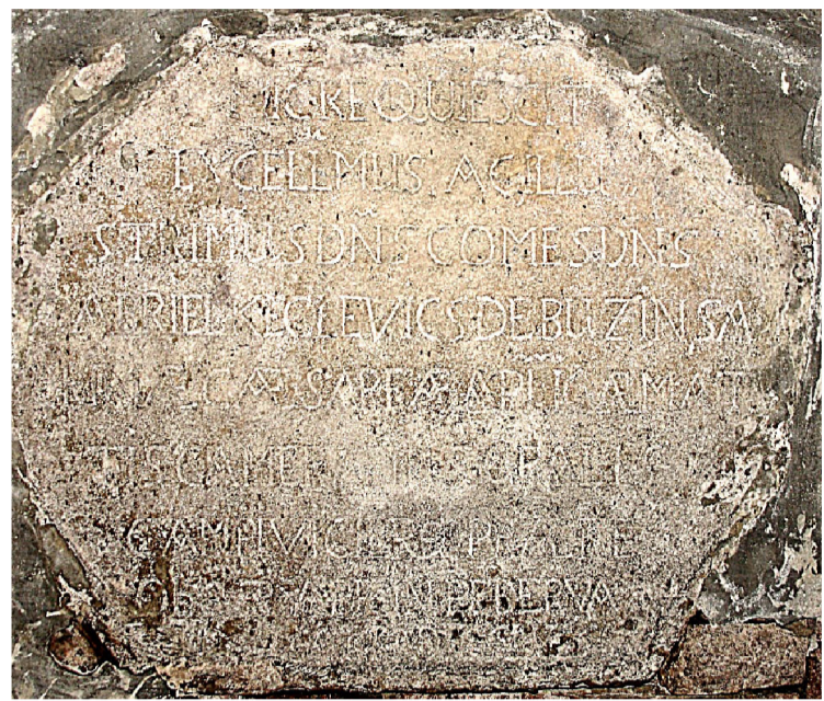
Amikor 2012 szeptemberében évszázados nyugalom után felnyitották a kápolna kriptáját, megilletődötten álltam az oda elsőként temetett Keglevich tábornok latin nyelvű sírtáblája előtt.

2010-ben Pro Urbe kitüntetésben részesült.